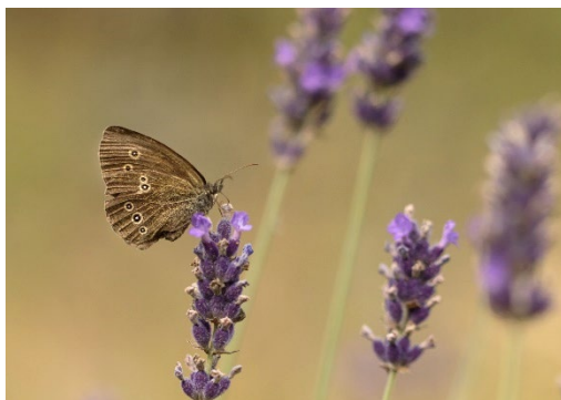
Luktgräsfjäril på lavendel.

TIPS! Biologiska mångfaldens dag firas den 22 maj med mängder av aktiviteter landet runt. Se vad som händer hos just dig! https://www.biomfdag.se/