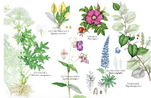
Invasiva, främmande arter.

Invasiva växter är främmande arter som bland annat påverkar våra ekosystem och hotar vår biologiska mångfald. I Sverige finns idag över 2 000 främmande arter och drygt 400 av dessa räknas som invasiva. Hur ser regelverket ut? Vilka är arterna? Varför har de blivit ett problem? Hur sker rapporteringen? Vad kan vi göra? Vilka bekämpningsmetoder fungerar? Vilka andra riskerar att bli de nya, invasiva främmande arterna?